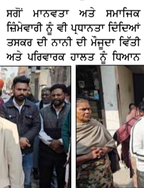
ਸਗੋਂ ਮਾਨਵਤਾ ਅਤੇ ਸਮਾਜਿਕ ਜ਼ਿੰਮੇਵਾਰੀ ਨੂੰ ਵੀ ਪ੍ਰਧਾਨਤਾ ਦਿੰਦਿਆਂ ਤਸਕਰ ਦੀ ਨਾਨੀ ਦੀ ਮੌਜੂਦਾ ਵਿੱਤੀ ਅਤੇ ਪਰਿਵਾਰਕ ਹਾਲਤ ਨੂੰ ਧਿਆਨ