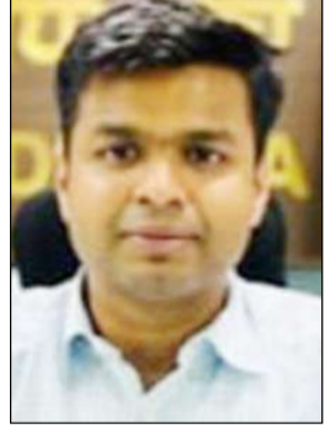
ਲਈ ਕੜੀਆਂ ਸੁਰੱਖਿਆ ਸ਼ਰਤਾਂ ਨਿਰਧਾਰਤ ਕੀਤੀਆਂ ਗਈਆਂ ਹਨ। ਉਨ੍ਹਾਂ ਦੱਸਿਆ ਕਿ ਇਨ੍ਹਾਂ ਸ਼ਰਤਾਂ ਵਿੱਚ ਬੱਸ ਦੇ ਅੱਗੇ ਅਤੇ ਪਿੱਛੇ 'ਸਕੂਲ ਬੱਸ', ਜੇਕਰ ਬੱਸ ਕਿਰਾਏ 'ਤੇ ਲਈ ਗਈ ਹੈ ਤਾਂ 'ਸਕੂਲ ਡਿਊਟੀ' 'ਤੇ ਲਿਖਿਆ ਹੋਣਾ