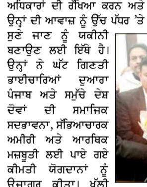
ਅਧਿਕਾਰਾਂ ਦੀ ਰੱਖਿਆ ਕਰਨ ਅਤੇ ਉਨ੍ਹਾਂ ਦੀ ਆਵਾਜ਼ ਨੂੰ ਉੱਚ ਪੱਧਰ 'ਤੇ ਸੁਣੇ ਜਾਣ ਨੂੰ ਯਕੀਨੀ ਬਣਾਉਣ ਲਈ ਇੱਥੇ ਹੈ। ਉਨ੍ਹਾਂ ਨੇ ਘੱਟ ਗਿਣਤੀ ਭਾਈਚਾਰਿਆਂ ਦੁਆਰਾ ਪੰਜਾਬ ਅਤੇ ਸਮੁੱਚੇ ਦੇਸ਼ ਦੇਵਾਂ ਦੀ ਸਮਾਜਿਕ ਸਦਭਾਵਨਾ, ਸੱਭਿਆਚਾਰਕ ਅਮੀਰੀ ਅਤੇ ਆਰਥਿਕ ਮਜ਼ਬੂਤੀ ਲਈ ਪਾਏ ਗਏ ਕੀਮਤੀ ਯੋਗਦਾਨਾਂ ਨੂੰ ਉਜਾਗਰ ਕੀਤਾ। ਖੁੱਲੀ ਸੁਣਵਾਈ ਦੌਰਾਨ, ਕਮਿਸ਼ਨ ਦੇ ਸਾਹਮਣੇ ਵੱਡੀ ਗਿਣਤੀ ਵਿੱਚ ਸ਼ਿਕਾਇਤਾਂ ਰੱਖੀਆਂ ਗਈਆਂ। ਸਭ ਤੋਂ ਵੱਧ ਉਠਾਏ ਜਾਣ ਵਾਲੇ ਮੁੱਦੇ ਜ਼ਮੀਨਾਂ ਅਤੇ ਜਾਇਦਾਦਾਂ 'ਤੇ ਗੈਰ-ਕਾਨੂੰਨੀ ਕਬਜ਼ੇ, ਈਸਾਈ