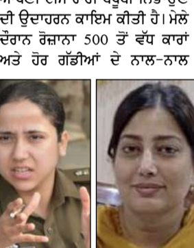
ਮਹਿਲਾਵਾਂ, ਬੱਚਿਆਂ ਅਤੇ ਆਮ ਲੋਕਾਂ ਦੀ ਸੁਰੱਖਿਆ ਨੂੰ ਯਕੀਨੀ ਬਣਾਇਆ ਗਿਆ ਹੈ। ਇਸ ਦੇ ਨਾਲ-ਨਾਲ ਮਹਿਲਾ ਪੁਲਿਸ ਕਰਮਚਾਰੀਆਂ ਦੀ ਵੀ ਖ਼ਾਸ ਧਿਆਨ 'ਤੇ ਡਿਊਟੀ ਲਗਾਈ ਗਈ ਹੈ, ਤਾਂ ਜੋ ਮਹਿਲਾਵਾਂ ਖੁਦ ਨੂੰ ਪੂਰੀ ਤਰ੍ਹਾਂ ਸੁਰੱਖਿਅਤ ਮਹਿਸੂਸ ਕਰ ਸਕਣ।

ਟਰੈਫਿਕ ਪ੍ਰਬੰਧਾਂ ਦੀ ਜ਼ਿੰਮੇਵਾਰੀ ਨੂੰ ਆਪਣੀ ਟੀਮ ਰਾਹੀਂ ਬਖੂਬੀ ਨਿਭਾਉਣ ਦੀ ਉਦਾਹਰਨ ਕਾਇਮ ਕੀਤੀ ਹੈ। ਮੇਲੇ ਦੌਰਾਨ ਰੋਜ਼ਾਨਾ 500 ਤੋਂ ਵੱਧ ਕਾਰਾਂ ਅਤੇ ਹੋਰ ਗੱਡੀਆਂ ਦੇ ਨਾਲ-ਨਾਲ