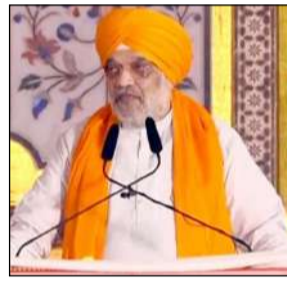
ਅੰਮਿਤ ਸ਼ਾਹ ਦਾ ਸਾਹਮਣਾ ਕੀਤਾ, ਪਰ ਅੱਜ ਅਸੀਂ ਕੁੱਝ ਲਾਲਚ ਕਾਰਨ ਧਰਮ ਪਰਿਵਰਤਨ ਨੂੰ ਤਰਜੀਹ ਦਿੰਦੇ ਹਾਂ, ਤਾਂ ਸਾਨੂੰ ਆਪਣੇ ਮਹਾਨ ਨੌਤਾਵਾਂ ਦੇ ਪੈਰੋਕਾਰ ਨਹੀਂ ਕਿਹਾ ਜਾ ਸਕਦਾ। ਪੰਜਾਬ ਸਰਕਾਰ ਅਤੇ ਪੰਜਾਬ ਸਮਾਜ ਨੂੰ ਧਰਮ ਪਰਿਵਰਤਨ ਬੰਦ ਕਰਵਾਉਣਾ ਚਾਹੀਦਾ ਹੈ। ਉਨ੍ਹਾਂ ਕਿਹਾ ਕਿ ਪੰਜਾਬ ਸਰਕਾਰ, ਸਮਾਜ ਅਤੇ ਸਾਰੇ ਧਰਮਾਂ ਦੇ ਲੋਕਾਂ ਨੂੰ ਉੱਚੇ ਹੋ ਰਹੇ ਧਰਮ ਪਰਿਵਰਤਨ ਨੂੰ ਰੋਕਣਾ ਚਾਹੀਦਾ ਹੈ।

ਧਰਮਪਰ (ਮੁੰਬਈ) : ਕੇਂਦਰੀ ਗ੍ਰਹਿ ਮੰਤਰੀ ਅੰਮਿਤ ਸ਼ਾਹ ਨੇ ਕਿਹਾ ਕਿ ਪੰਜਾਬ 'ਚ ਧਰਮ ਪਰਿਵਰਤਨ ਹੋ ਰਿਹਾ ਹੈ। ਉਨ੍ਹਾਂ ਭਗਵੰਤ ਮਾਨ ਸਰਕਾਰ ਅਤੇ ਆਮ ਲੋਕਾਂ ਨੂੰ ਅਪੀਲ ਕੀਤੀ ਹੈ ਕਿ ਉਹ 'ਲਾਲਚ' ਦੇ ਕੇ ਚਲਾਈ ਜਾ ਰਹੀ ਇਸ ਪ੍ਰਥਾ ਨੂੰ ਬੰਦ ਕਰਵਾਉਣ। ਸ਼ਾਹ ਨੇ ਸ੍ਰੀ ਗੁਰੂ ਤੇਗ ਬਹਾਦਰ ਜੀ ਦੇ 350ਵੇਂ ਸ਼ਹੀਦੀ ਦਿਹਾੜੇ ਨੂੰ ਸਮਰਪਿਤ ਨਵੀਂ ਮੁੰਬਈ ਦੇ ਖਾਰਘਰ 'ਚ 'ਹਿੰਦ-ਦੀ-ਚਾਦਰ' ਯਾਦਗਾਰੀ ਸਮਾਗਮ ਨੂੰ ਸੰਬੰਧਤ ਕਰਦਿਆਂ ਸ੍ਰੀ ਗੁਰੂ ਤੇਗ ਬਹਾਦਰ ਜੀ ਦੀ ਕੁਰਬਾਨੀ ਦਾ ਜ਼ਿਕਰ ਕੀਤਾ। ਅੰਮਿਤ ਸ਼ਾਹ ਨੇ ਕਿਹਾ, "ਅੱਜ ਇੱਥੇ ਕਿਹਾ ਜਾ ਰਿਹਾ ਹੈ ਕਿ ਪੰਜਾਬ ਵਿਚ ਧਰਮ ਪਰਿਵਰਤਨ ਹੋ ਰਿਹਾ ਹੈ। ਗੁਰੂ ਤੇਗ ਬਹਾਦਰ ਜੀ ਨੇ ਦੂਸਰਿਆਂ ਦੇ ਧਰਮ ਨੂੰ ਬਚਾਉਣ ਲਈ ਆਪਣੇ ਆਪ ਨੂੰ ਕੁਰਬਾਨ ਕਰ ਦਿਤਾ। ਉਨ੍ਹਾਂ ਨੇ