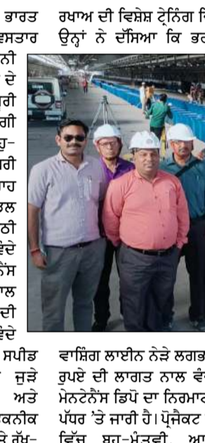
ਵਾਸ਼ਿੰਗ ਲਾਈਨ ਨੇੜੇ ਲਗਭਗ 167 ਕਰੋੜ ਰੁਪਏ ਦੀ ਲਾਗਤ ਨਾਲ ਵੇਦੇ ਭਾਰਤ ਕੋਚ ਮੋਨਟੇਨੇਸ ਡਿਪੋ ਦਾ ਨਿਰਮਾਣ ਕਾਰਜ ਜੰਗੀ ਪੱਧਰ 'ਤੇ ਜਾਰੀ ਹੈ। ਪ੍ਰੋਜੈਕਟ ਦੇ ਦੂਜੇ ਪੜਾਅ ਵਿੱਚ ਬਹੁ-ਮੰਤਵੀ, ਆਧੁਨਿਕ ਅਤੇ