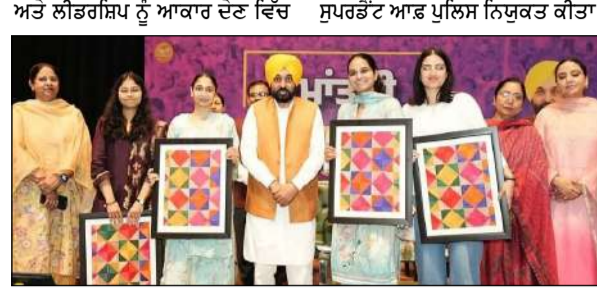
ਅਤੇ ਲੀਡਰਸ਼ਿਪ ਨੂੰ ਆਕਾਰ ਦੇਣ ਵਿੱਚ ਸ਼ੁਪਰਡੈਂਟ ਆਫ਼ ਪੁਲਿਸ ਨਿਯੁਕਤ ਕੀਤਾ ਨੌਜਵਾਨਾਂ ਨੂੰ 63,000 ਤੋਂ ਵੱਧ ਦਿੱਤੀਆਂ ਗਈਆਂ ਹਨ ਅਤੇ ਜ਼ਿਆਦਾਤਰ ਲਾਭਪਾਤਰੀ ਕੁੜੀਆਂ ਹਨ : ਮੁੱਖ ਮੰਤਰੀ

ਕਰ ਰਹੀ ਹੈ ਜੋ ਔਰਤਾਂ ਨੂੰ ਮੁੱਖ ਖੇਤਰਾਂ ਤੋਂ ਦੂਰ ਰੱਖਦੀਆਂ ਸਨ। ਉਨ੍ਹਾਂ ਨੇ ਯੋਗਤਾ-ਆਧਾਰਤ ਭਰਤੀ ਵੱਲ ਇਸ਼ਾਰਾ ਕੀਤਾ ਜਿੱਥੇ 63,000 ਤੋਂ ਵੱਧ ਸਰਕਾਰੀ ਨੌਕਰੀਆਂ ਵਿੱਚੋਂ ਜ਼ਿਆਦਾਤਰ ਕੁੜੀਆਂ ਨੂੰ ਗਈਆਂ ਹਨ, ਗੈਰ-ਵਾਜਬ ਹਾਲਤਾਂ ਨੂੰ ਦੂਰ ਕਰਨ ਤੋਂ ਬਾਅਦ ਔਰਤਾਂ ਲਈ ਅੱਗੇ ਬੁਝਾਉ ਸੇਵਾਵਾਂ ਖੋਲ੍ਹਣਾ, ਅਤੇ ਉੱਚ ਪ੍ਰਸ਼ਾਸਨਿਕ ਅਹੁਦਿਆਂ 'ਤੇ ਮਹਿਲਾ ਅਧਿਕਾਰੀਆਂ ਦੀ ਵੱਧ ਰਹੀ ਮੌਜੂਦਗੀ। ਮੁੱਖ ਮੰਤਰੀ ਭਗਵੰਤ ਸਿੰਘ ਮਾਨ ਨੇ ਨੌਜਵਾਨ ਔਰਤਾਂ ਨੂੰ ਰਾਜਨੀਤੀ ਵਿੱਚ ਆਉਣ ਅਤੇ ਫੈਸਲਾ ਲੈਣ ਵਿੱਚ ਸਰਗਰਮ ਭਾਗੀਦਾਰ ਬਣਨ ਦੀ ਅਪੀਲ ਕੀਤੀ, ਇਸ ਗੱਲ 'ਤੇ ਜ਼ੋਰ ਦਿੰਦੇ ਹੋਏ ਕਿ ਇੱਕ ਮਜ਼ਬੂਤ ਲੋਕਤੰਤਰ ਅਤੇ ਇੱਕ ਵਧੇਰੇ ਪ੍ਰਗਤੀਸ਼ੀਲ ਪੰਜਾਬ ਤਾਂ ਹੀ ਸੰਭਵ ਹੋਵੇਗਾ ਜਦੋਂ ਔਰਤਾਂ ਜਨਤਕ ਨੀਤੀ