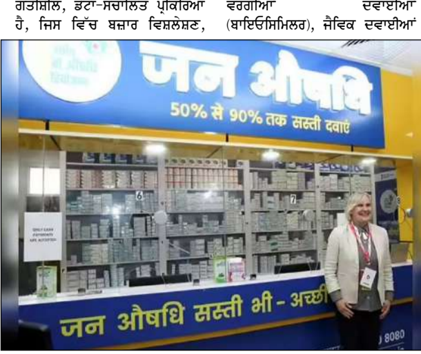
ਗੁਣੀਸ਼ੀਲ, ਡੇਟਾ-ਸੰਚਾਲਿਤ ਪ੍ਰਕਿਰਿਆ ਹੈ, ਜਿਸ ਵਿੱਚ ਬਜ਼ਾਰ ਵਿਸ਼ਲੇਸ਼ਣ, ਵਰਗੀਆਂ (ਥਾਇਓਸਿਲਿਮਿਲਰ), ਜੈਵਿਕ ਦਵਾਈਆਂ ਦਵਾਈਆਂ ਦੁਆਰਾ ਮਨਜ਼ੂਰਗਤ ਪ੍ਰਯੋਗਸ਼ਾਲਾਵਾਂ ਵਿੱਚ ਸਖਤੀ ਨਾਲ ਤਸਦੀਕ ਹੋਣ ਲਾਜ਼ਮੀ ਹੈ। ਇਹ ਦਵਾਈਆਂ ਡਰੱਗਸ ਐਂਡ ਕੋਸਮੇਟਿਕਸ ਐਕਟ, 1940 ਦੇ ਨਿਯਮਾਂ ਦੀ ਪਾਲਣਾ ਕਰਦੀਆਂ ਹਨ ਅਤੇ ਬੁਝਿਝੜ ਵਿਕਲਪ ਦੇ ਸੁਰੱਖਿਆ ਅਤੇ ਪ੍ਰਭਾਵਸ਼ੀਲਤਾ ਮਿਆਰਾਂ ਦੇ ਅਨੁਸਾਰ ਹਨ। ਗੁਣਵੱਤਾ ਨੂੰ ਯਕੀਨੀ ਬਣਾਉਣ ਲਈ ਖਰੀਦ ਤੋਂ ਪਹਿਲਾਂ ਸਾਵਧਾਨੀਪੂਰਕ ਸਮੀਖਿਆ ਕੀਤੀ ਜਾਂਦੀ ਹੈ ਅਤੇ ਖਰੀਦ ਤੋਂ ਬਾਅਦ ਪ੍ਰਯੋਗਸ਼ਾਲਾ ਵਿੱਚ ਟੈਸਟਿੰਗ ਕੀਤੀ ਜਾਂਦੀ ਹੈ। ਪ੍ਰੋਜੈਕਟ ਦੀ ਲਾਗੂਕਰਨ ਏਜੰਸੀ, ਪੀਐੱਮਬੀਐੱਸਪੀ ਨਿਯਮਿਤ ਤੌਰ 'ਤੇ ਦਵਾਈਆਂ ਦੀ ਗੁਣਵੱਤਾ ਦੀ ਨਿਗਰਾਨੀ ਅਤੇ ਸਮੀਖਿਆ ਕਰਦੀ ਹੈ, ਤਾਂ ਜੋ ਸਥਾਪਿਤ ਨਿਯਮਾਂ ਦੀ ਪਾਲਣਾ ਵਿੱਚ ਕੋਈ ਫਿੱਲ ਨਾ ਹੋਣਾ ਯਕੀਨੀ ਬਣਾਇਆ ਜਾ ਸਕੇ। ਇੱਕ ਆਈਟੀ-ਸੰਚਾਲਿਤ ਵੇਬ ਨੈੱਟਵਰਕ, ਜਿਸ ਨੂੰ ਪੰਜ ਅੰਤਰ-ਆਧੁਨਿਕ ਵੇਅਰਹਾਊਸ ਅਤੇ 41 ਵਿਸ਼ੇਸ਼ ਵਿਤਰਕਾਂ ਦੁਆਰਾ ਸਮਰਥਤ ਪ੍ਰਯੋਗ ਹੈ, ਨੇ ਇਹ ਯਕੀਨੀ ਬਣਾਇਆ ਹੈ ਕਿ ਸਪਲਾਈ ਚੇਨ ਤੁਕਾਵਟਾਂ ਦੇ ਵਿਰੁੱਧ ਲਚਕਦਾਰ ਬਣੀ ਹੈ। ਤਿੰਨ ਥੰਮ੍ਹਾਂ - ਪਹੁੰਚ, ਗੁਣਵੱਤਾ ਅਤੇ ਸਸਤੀ ਕੀਮਤ - ਤੇ ਧਿਆਨ ਕੇਂਦਰਿਤ

ਕਿਸੇ ਰਾਸ਼ਟਰ ਦੀ ਪ੍ਰਗਤੀ ਦਾ ਅਸਲ ਪੈਮਾਨਾ ਅਕਸਰ ਇਸ ਗੱਲ ਵਿੱਚ ਝਲਕਦਾ ਹੈ ਕਿ ਉਸ ਦੇ ਨਾਗਰਿਕ ਸਿਹਤ ਸੇਵਾ ਵਰਗੀਆਂ ਬੁਨਿਆਦੀ ਜ਼ਰੂਰਤਾਂ ਤੱਕ ਕਿੰਨੀ ਆਸਾਨੀ ਨਾਲ ਪਹੁੰਚ ਸਕਦੇ ਹਨ ਦਰਮਿਆਨ ਤੱਕ, ਭਾਰਤ ਦੇ ਲੱਖਾਂ ਲੋਕਾਂ ਦੀ ਸਿਹਤ ਅਤੇ ਆਰੋਗਯ ਲਈ ਦਵਾਈਆਂ ਦੀ ਉੱਚ ਲਾਗਤ ਇੱਕ ਮੁੱਖ ਵਿੱਤੀ ਰੁਕਾਵਟ ਰਹੀ ਹੈ। ਇਸ ਸੰਦਰਭ ਵਿੱਚ, ਪ੍ਰਧਾਨ ਮੰਤਰੀ ਭਾਰਤੀ ਜਨਐਸ਼ੀਏ ਪਰਿਯੋਜਨਾ (ਪੀਐੱਮਬੀਐੱਸਪੀ), ਪ੍ਰਧਾਨ ਮੰਤਰੀ ਨਰੇਂਦਰ ਮੋਦੀ ਦੀ ਅਗਵਾਈ ਵਿੱਚ ਗੁਣਵੱਤਾ ਵਾਲੀਆਂ ਮੈਨੇਰਿਕ ਦਵਾਈਆਂ ਨੂੰ ਉਨ੍ਹਾਂ ਦੇ ਬੁਝਿਝੜ ਹਮਲੂਕੇ ਦੀ ਤੁਲਨਾ ਵਿੱਚ ਕਾਫ਼ੀ ਘੱਟ ਕੀਮਤ 'ਤੇ ਉਪਲਬਧ ਕਰਵਾਉਣ ਦੇ ਉਦੇਸ਼ ਨਾਲ ਸ਼ੁਰੂ ਕੀਤੀ ਗਈ ਪਹਿਲ ਹੈ। ਇਹ ਪ੍ਰੋਜੈਕਟ ਜਨਤਕ ਸਿਹਤ ਦੇਖਭਾਲ ਵਿੱਚ ਇੱਕ ਮਹੱਤਵਪੂਰਨ ਪਾੜੇ ਨੂੰ ਦੂਰ ਕਰਕੇ ਇੱਕ ਵਿਕਾਸ ਅਤੇ ਵਿਵਸਥਿਤ ਪਰਿਵਰਤਨ ਲਿਆਉਣ ਵਿੱਚ ਸਫਲ ਰਹੀ ਹੈ। ਵਿਸ਼ੇਸ਼ ਤੌਰ 'ਤੇ, ਮੈਨੇਰਿਕ ਦਵਾਈਆਂ ਸੁਲੱਭ ਸਿਹਤ ਦੇਖਭਾਲ ਵਿੱਚ ਮਹੱਤਵਪੂਰਨ ਭੂਮਿਕਾ ਨਿਭਾਈ ਹੈ। ਹਾਲਾਂਕਿ ਮੈਨੇਰਿਕ ਦਵਾਈਆਂ ਪੇਂਸ਼ਨ, ਲੋਥ ਅਤੇ ਅਕਿਰਿਆਸ਼ੀਲ ਪੇਂਸ਼ਨ ਦੀ ਦ੍ਰਿਸ਼ਟੀ ਨਾਲ ਵੱਖ ਹੋ ਸਕਦੀਆਂ ਹਨ, ਪਰ ਖੋਜ ਤੋਂ ਪਤਾ ਚੱਲਿਆ ਹੈ ਕਿ ਇਹ ਅੰਤਰ ਉਨ੍ਹਾਂ ਦੇ ਮਿਲਾਪ ਸਬੰਧੀ ਪ੍ਰਭਾਵ 'ਤੇ ਅਸਰ