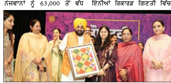
ਸਰਕਾਰੀ ਨੌਕਰੀਆਂ ਪ੍ਰਦਾਨ ਕੀਤੀਆਂ ਹਨ। ਉਨ੍ਹਾਂ ਕਿਹਾ, "ਇਹ ਮਾਣ ਵਾਲੀ ਗੱਲ ਹੈ ਕਿ ਇਨ੍ਹਾਂ ਵਿੱਚੋਂ ਜ਼ਿਆਦਾਤਰ ਨੌਕਰੀਆਂ ਕੁੜੀਆਂ ਨੂੰ ਗਈਆਂ ਹਨ। ਸੂਬੇ ਦੇ ਇਤਿਹਾਸ ਵਿੱਚ ਪਹਿਲੀ ਵਾਰ ਕਿਸੇ ਸਰਕਾਰ ਨੇ ਬਿਨਾਂ ਕਿਸੇ ਭ੍ਰਿਸ਼ਟਾਚਾਰ ਜਾਂ ਭਾਈ-ਭਤੀਜਾਵਾਦ ਦੇ, ਪੂਰੀ ਤਰ੍ਹਾਂ ਯੋਗਤਾ ਦੇ ਆਧਾਰ 'ਤੇ ਨੌਕਰੀਆਂ ਦਿੱਤੀਆਂ ਹਨ। ਮੈਨੂੰ ਵਿਸ਼ਵਾਸ ਹੈ ਕਿ ਇਹ ਲੜਕੀਆਂ ਆਪਣੇ-ਆਪਣੇ ਵਿਭਾਗਾਂ ਵਿੱਚ ਸੇਵਾ ਕਰਦੇ ਹੋਏ ਸੂਬੇ ਦੇ ਸਮਾਜਿਕ-ਆਰਥਿਕ ਵਿਕਾਸ ਵਿੱਚ ਸਰਗਰਮ ਭੂਮਿਕਾ ਨਿਭਾਉਣਗੀਆਂ। ਇੱਕ ਗੁਪਤ ਬਣਾਉਣ ਹੋਵੇ, ਉਨ੍ਹਾਂ ਕਿਹਾ ਕਿ ਵਿਭਿੰਨਤਾ ਸਮਾਜ ਨੂੰ ਉਸੇ ਤਰ੍ਹਾਂ

ਮਜ਼ਬੂਤ ਬਣਾਉਣੀ ਹੈ ਜਿਵੇਂ ਵੱਖ-ਵੱਖ ਫੁੱਲ ਇੱਕ ਗੁਲਦਸਤੇ ਨੂੰ ਸੁੰਦਰ ਬਣਾਉਂਦੇ ਹਨ। "ਇੱਕ ਗੁਲਦਸਤੇ ਵਿੱਚ ਕਈ ਤਰ੍ਹਾਂ ਦੇ ਫੁੱਲ ਹੁੰਦੇ ਹਨ ਅਤੇ ਇਸੇ ਕਰਕੇ ਲੋਕ ਇਸ ਤੋਂ ਆਰਕਸ਼ਤ ਹੁੰਦੇ ਹਨ। ਇਸੇ ਤਰ੍ਹਾਂ, ਜਦੋਂ ਹਰ ਕੋਈ ਆਪਣੀ ਪ੍ਰਤਿਭਾ ਅਤੇ ਸਮਰੱਥਾ ਨਾਲ ਸਮਾਜ ਵਿੱਚ ਯੋਗਦਾਨ ਪਾਉਂਦਾ ਹੈ, ਤਾਂ ਇਹ ਪੂਰੀ ਪ੍ਰਣਾਲੀ ਨੂੰ ਮਜ਼ਬੂਤੀ ਦਿੰਦਾ ਹੈ, ਉਨ੍ਹਾਂ ਅੱਗੇ ਕਿਹਾ। ਮੁੱਖ ਮੰਤਰੀ ਨੇ ਕਿਹਾ ਕਿ ਪੰਜਾਬ ਦੇਸ਼ ਦੇ ਇਤਿਹਾਸ ਅਤੇ ਪਛਾਣ ਵਿੱਚ ਇੱਕ ਵਿਲੱਖਣ ਸਥਾਨ ਰੱਖਦਾ ਹੈ। ਪੰਜਾਬ ਨਾ ਸਿਰਫ਼ ਦੇਸ਼ ਦਾ ਔਰਤਾਂ ਦਾ ਹੈ, ਸਗੋਂ ਦੇਸ਼ ਦੀ ਤਲਵਾਰ ਦੀ ਭੂਜਾ ਵੀ ਹੈ। ਪੰਜਾਬ ਦੇ ਲੋਕ ਦੁਨੀਆ ਭਰ ਵਿੱਚ ਆਪਣੀ ਹਿਮਤ, ਲਚਕੀਲੇਪਣ ਅਤੇ ਉੱਦਮ ਦੀ ਭਾਵਨਾ ਲਈ ਜਾਣੇ ਜਾਂਦੇ ਹਨ। ਇਸ ਪਵਿੱਤਰ ਧਰਤੀ ਦਾ ਹਰ ਇੱਕ ਮਹਾਨ ਗੁਰੂਆਂ, ਸੰਤਾਂ, ਸੰਤਾਂ ਅਤੇ ਸ਼ਹੀਦਾਂ ਦੇ ਪੈਰਾਂ ਦੇ ਨਿਸ਼ਾਨ ਰੱਖਦਾ ਹੈ ਜਿਨ੍ਹਾਂ ਨੇ ਸਾਨੂੰ ਜ਼ੁਲਮ, ਬੇਇਨਸਾਫੀ ਅਤੇ ਜ਼ੁਲਮ ਦਾ ਵਿਰੋਧ ਕਰਨ ਦਾ ਰਸਤਾ ਦਿਖਾਇਆ। ਪੰਜਾਬ ਦੀ ਇੱਕ ਅਮੀਰ ਸੱਭਿਆਚਾਰਕ ਵਿਰਾਸਤ ਹੈ ਅਤੇ ਇਹ ਵਿਸ਼ਵ ਪੱਧਰ 'ਤੇ ਆਪਣੀ ਨਿੱਖੀ ਮਹਿਮਾਨਨਿਵਾਜ਼ੀ ਲਈ ਜਾਣਿਆ ਜਾਂਦਾ ਹੈ, ਉਨ੍ਹਾਂ ਜ਼ੋਰ ਦੇ ਕੇ ਕਿਹਾ। ਔਰਤਾਂ ਨੂੰ ਰਾਜਨੀਤੀ ਵਿੱਚ ਸਰਗਰਮੀ ਨਾਲ ਹਿੱਸਾ ਲੈਣ ਦੀ ਅਪੀਲ ਕਰਦੇ ਹੋਏ, ਮੁੱਖ ਮੰਤਰੀ ਨੇ ਕਿਹਾ ਕਿ ਲੋਕਤੰਤਰੀ ਸੰਸਥਾਵਾਂ ਨੂੰ ਮਜ਼ਬੂਤ ਕਰਨ ਅਤੇ ਅਰਥਪੂਰਨ ਸਮਾਜਿਕ ਬੁਨਿਆਦੀ ਲਿਆਉਣ ਲਈ ਉਨ੍ਹਾਂ ਦੀ ਸ਼ਕਤੀਅਤ ਜ਼ਰੂਰੀ ਹੈ।