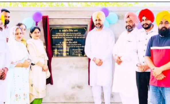
ਬੱਚਿਆਂ ਨੂੰ ਪੜ੍ਹਾਈ ਦੇ ਨਾਲ-ਨਾਲ ਸੁਖ-ਸੁਰਲੱਖ ਮੁਹੱਈਆ ਕਰਵਾਈਆਂ ਜਾ ਰਹੀਆਂ ਹਨ, ਤਾਂ ਜੋ ਬੱਚਿਆਂ ਨੂੰ ਸਕੂਲਾਂ ਵਿੱਚ ਵੀ ਘਰਾਂ ਵਰਗਾ ਸੁਖਾਵਾਂ ਮਾਹੌਲ ਮਿਲਦਾ ਰਹੇ। ਇਸ ਮੌਕੇ ਸਮੂਹ ਸਟਾਫ਼ ਵਲੋਂ ਜ਼ਿਲ੍ਹਾ