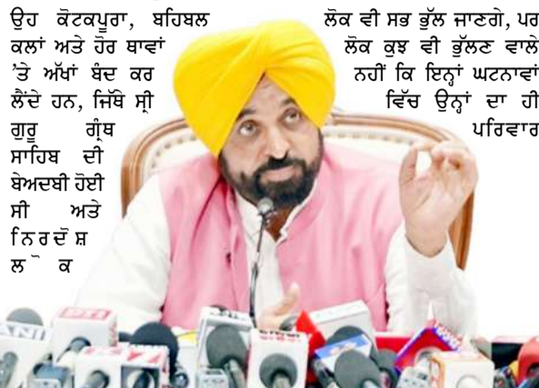
ਮੁੱਖ ਮੰਤਰੀ ਭਗਵੰਤ ਸਿੰਘ ਮਾਨ ਨੇ ਅੱਜ ਇੱਥੇ ਪਿਛਲੀਆਂ 'ਬੇਅਦਬੀ' ਦੀਆਂ ਘਟਨਾਵਾਂ ਨੂੰ ਲੈ ਕੇ ਸੁਖਬੀਰ ਸਿੰਘ ਬਾਦਲ ਅਤੇ ਸ਼ੋਮਣੀ ਅਕਾਲੀ ਦਲ 'ਤੇ ਤਿੱਖਾ ਹਮਲਾ ਕਰਦਿਆਂ ਕਿਹਾ ਕਿ ਆਮ ਆਦਮੀ ਪਾਰਟੀ ਦੀ ਸਰਕਾਰ ਕਾਨੂੰਨਾਂ ਨੂੰ ਸਖ਼ਤ ਬਣਾ ਕੇ ਅਤੇ ਸਖ਼ਤ ਸਜ਼ਾਵਾਂ ਲਾਗੂ ਕਰਕੇ ਇਸ ਸਬੰਧੀ ਇਨਸਾਫ਼ ਯਕੀਨੀ ਬਣਾਉਣ ਲਈ ਵੇਸਲਾਕੁੰਨ ਕਦਮ ਚੁੱਕ ਰਹੀ ਹੈ। ਫਤਿਹਗੜ੍ਹ ਸਾਹਿਬ ਵਿੱਚ ਵਿਸ਼ਾਲ ਇਕੱਠੇ ਨੂੰ ਸੋਧਣ ਕਰਦਿਆਂ ਮੁੱਖ ਮੰਤਰੀ ਭਗਵੰਤ ਸਿੰਘ ਮਾਨ ਨੇ ਕਿਹਾ ਕਿ ਸੁਖਬੀਰ ਸਿੰਘ ਬਾਦਲ ਵੱਡੇ-ਵੱਡੇ ਦਾਅਵੇ ਕਰਦਾ ਹੈ ਕਿ ਸਭ ਕੁਝ ਉਨ੍ਹਾਂ ਦਾ ਬਣਾਇਆ ਹੋਇਆ ਹੈ, ਪਰ

ਪੰਜਾਬ ਦੇ ਮੁੱਖ ਮੰਤਰੀ ਭਗਵੰਤ ਸਿੰਘ ਮਾਨ ਨੇ ਅੱਜ ਇੱਥੇ ਪਿਛਲੀਆਂ 'ਬੇਅਦਬੀ' ਦੀਆਂ ਘਟਨਾਵਾਂ ਨੂੰ ਲੈ ਕੇ ਸੁਖਬੀਰ ਸਿੰਘ ਬਾਦਲ ਅਤੇ ਸ਼ੋਮਣੀ ਅਕਾਲੀ ਦਲ 'ਤੇ ਤਿੱਖਾ ਹਮਲਾ ਕਰਦਿਆਂ ਕਿਹਾ ਕਿ ਆਮ ਆਦਮੀ ਪਾਰਟੀ ਦੀ ਸਰਕਾਰ ਕਾਨੂੰਨਾਂ ਨੂੰ ਸਖ਼ਤ ਬਣਾ ਕੇ ਅਤੇ ਸਖ਼ਤ ਸਜ਼ਾਵਾਂ ਲਾਗੂ ਕਰਕੇ ਇਸ ਸਬੰਧੀ ਇਨਸਾਫ਼ ਯਕੀਨੀ ਬਣਾਉਣ ਲਈ ਵੇਸਲਾਕੁੰਨ ਕਦਮ ਚੁੱਕ ਰਹੀ ਹੈ। ਫਤਿਹਗੜ੍ਹ ਸਾਹਿਬ ਵਿੱਚ ਵਿਸ਼ਾਲ ਇਕੱਠੇ ਨੂੰ ਸੋਧਣ ਕਰਦਿਆਂ ਮੁੱਖ ਮੰਤਰੀ ਭਗਵੰਤ ਸਿੰਘ ਮਾਨ ਨੇ ਕਿਹਾ ਕਿ ਸੁਖਬੀਰ ਸਿੰਘ ਬਾਦਲ ਵੱਡੇ-ਵੱਡੇ ਦਾਅਵੇ ਕਰਦਾ ਹੈ ਕਿ ਸਭ ਕੁਝ ਉਨ੍ਹਾਂ ਦਾ ਬਣਾਇਆ ਹੋਇਆ ਹੈ, ਪਰ