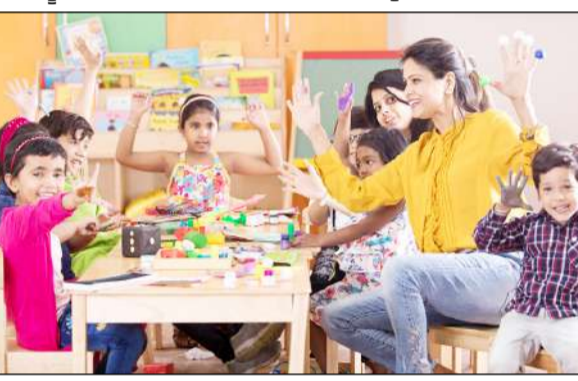
ਚਾਹੀਦਾ ਹੈ - ਨਾ ਸਿਰਫ ਮਨ ਦਾ, ਸਗੋਂ ਸਰੀਰ ਅਤੇ ਦਿਲ ਦਾ ਵੀ। ਸਰੀਰਕ ਗਤੀਵਿਧੀ ਅਤੇ ਪੇਸ਼ਣ ਰੋਜ਼ਾਨਾ ਸਕੂਲੀ ਜੀਵਨ ਦੇ ਅਨਿੱਖੜਵੇਂ ਅੰਗ ਹਨ। ਇੱਕ ਸਿਹਤਮੰਦ ਬੱਚਾ ਬਿਹਤਰ ਸਿੱਖਣਾ ਹੈ, ਜਿਸਦਾ ਹਿੱਸਾ ਲੈਣਾ ਹੈ, ਅਤੇ ਆਤਮ-ਮਾਣ ਦੀ ਸਿਹਤਮੰਦ ਭਾਵਨਾ ਦੇ ਨਾਲ ਵਿਕਸਿਤ ਹੁੰਦਾ ਹੈ।

ਮਾਪਿਆਂ ਦੀ ਭੂਮਿਕਾ ਸੁਧਾਰ ਸਿਰਫ ਨੀਤੀਗਤ ਦਸਤਾਵੇਜ਼ਾਂ ਰਾਹੀਂ ਬੱਚਿਆਂ ਤੱਕ ਨਹੀਂ ਪਹੁੰਚਦੇ; ਇਹ ਅਧਿਆਪਕਾਂ ਰਾਹੀਂ ਹੀ ਲਾਗੂ ਹੁੰਦਾ ਹੈ। ਉਹ ਹੀ ਸਿੱਖਿਆ ਦੇ ਪਰਿਵਰਤਨ ਦੇ ਸੱਚੇ ਸੁਰੂਭਾਗ ਹਨ, ਜੋ ਹੁਣ ਦਿਸ਼ਟੀ ਅਤੇ ਕਲਾਸਰੂਮ ਦੀ ਵੀਕਰ ਵਿਚਾਰ ਪਾੜੇ ਨੂੰ ਪੂਰਾ ਕਰਦੇ ਹਨ। ਅਧਿਆਪਕਾਂ ਨੂੰ ਬਹੁ-ਭਾਸ਼ੀਣੀ ਵਾਤਾਵਰਣ ਵਿੱਚ ਪੜ੍ਹਾਉਣਾ ਚਾਹੀਦਾ ਹੈ ਅਤੇ ਇਹ ਵੀ ਯਕੀਨੀ ਬਣਾਉਣਾ ਚਾਹੀਦਾ ਹੈ ਕਿ ਬੱਚੇ ਦੀ ਮਾਤ੍ਰ ਭਾਸ਼ਾ ਦਾ ਸਨਮਾਨ ਕੀਤਾ ਜਾਵੇ ਅਤੇ ਉਸ ਨੂੰ ਸਿੱਖਣ ਲਈ ਸਿਹਤਮੰਦ ਵਜੋਂ ਸੰਰਚਨਾ ਜਾਵੇ। ਇਸ ਤੋਂ ਮਹੱਤਵ ਦੇ ਕੇ, ਅਸੀਂ ਇਹ ਵੀ ਯਕੀਨੀ ਬਣਾਉਂਦੇ ਹਾਂ ਕਿ ਰਸਮੀ ਸਿੱਖਿਆ ਵਿੱਚ ਉਨ੍ਹਾਂ ਦਾ ਸੰਕ੍ਰਮਣ