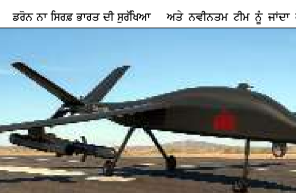
ਡਰੋਨ ਨਾ ਸਿਰਫ ਭਾਰਤ ਦੀ ਸੁਰੱਖਿਆ ਅਤੇ ਨਵੀਨਤਮ ਟੀਮ ਨੂੰ ਜਾਂਦਾ ਹੈ, ਨਿਭਾਈ ਹੈ।

ਕਰਦਾ ਹੈ ਕਿ ਭਾਰਤ ਘੱਟ ਲਾਗਤ ਵਿੱਚ ਉੱਚ ਗੁਣਵੱਤਾ ਵਾਲੀ ਰੱਖਿਆ ਤਕਨੀਕ ਵਿਕਸਤ ਕਰ ਸਕਦਾ ਹੈ। ਇਸ ਦੀ ਸਫਲਤਾ ਦਾ ਸਬੂਤ 30 ਮਿਲੀਅਨ ਡਾਲਰ ਦਾ ਨਿਰਯਾਤ ਸੰਦਾ ਹੈ, ਜੋ ਇੱਕ ਅਣਪਛਾਤੇ ਏਸ਼ੀਆਈ ਦੇਸ਼ ਨਾਲ ਸਾਈਨ ਕੀਤਾ ਗਿਆ ਹੈ। ਇਸ ਸੰਦੇ ਵਿੱਚ ਡਰੋਨ ਦੇ ਨਾਲ-ਨਾਲ ਮੋਨਟੇਨੋਸ, ਰਿਪੋਅਰ ਅਤੇ ਓਵਰਹਾਲ ਸੇਵਾਵਾਂ ਵੀ ਸ਼ਾਮਲ ਹਨ। ਜੋ ਇਸ ਦੀ ਵਪਾਰਕ ਸੰਭਾਵਨਾ ਨੂੰ ਹੋਰ ਮਜ਼ਬੂਤ ਕਰਦੀਆਂ ਹਨ। ਕਾਲ ਭੈਰਵ ਨੂੰ ਬੰਗਲੌਰ ਦੇ ਇੱਕ ਸਮਾਜਿਕ ਵਿੱਚ ਅਧਿਕਾਰਤ ਤੌਰ 'ਤੇ ਲਾਂਚ ਕੀਤਾ ਗਿਆ, ਜੋ ਦਾ ਲਿਜਟ ਅਸ਼ੋਕ ਹੋਟਲ ਵਿਖੇ ਆਯੋਜਿਤ ਕੀਤਾ ਗਿਆ ਸੀ। ਇਸ ਮੌਕੇ 'ਤੇ ਰੱਖਿਆ ਖੇਤਰ ਦੇ ਮਾਹਿਰਾਂ, ਸਰਕਾਰੀ ਅਧਿਕਾਰੀਆਂ ਅਤੇ ਉਦਯੋਗਿਕ ਨੇਤਾਵਾਂ ਨੇ ਸ਼ਿਰਠ ਕੀਤੀ, ਜਿਨ੍ਹਾਂ ਨੇ ਇਸ ਪਾਪਤੀ ਨੂੰ ਭਾਰਤ ਦੀ ਰੱਖਿਆ ਨਿਰਮਾਣ ਸਮਰੱਥਾ ਦਾ ਇੱਕ ਮਹੱਤਵਪੂਰਨ ਪ੍ਰਦਰਸ਼ਨ ਮੰਨਿਆ। ਇਹ