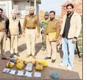
ਟੀਮਾਂ ਅਤੇ ਬਾਰਡਰ ਸਿਕਿਰਿਟੀ ਫੋਰਸ ਦੀ ਚੋਕੀ ਨੇ ਇਨ੍ਹਾਂ ਕੋਸ਼ਿਸ਼ਾਂ ਨੂੰ ਖ਼ੁਰ ਨਹੀਂ ਪੈਣ ਦਿੱਤਾ। ਸਾਂਝੇ ਓਪਰੇਸ਼ਨ ਦੌਰਾਨ 25 ਕਿੱਲੋ ਹੈਰੋਇਨ ਅਤੇ ਪਿਸਟਲਾਂ ਤੋਂ ਇਲਾਵਾ ਕਾਰਤੂਸ ਵੀ ਬਰਾਮਦ ਕੀਤੇ ਗਏ ਹਨ। ਰਿਕਵਰੀ ਡਰੋਨ ਦੀ ਵਰਤੋਂ ਕਰਕੇ ਇੱਕ ਸੰਗਠਿਤ