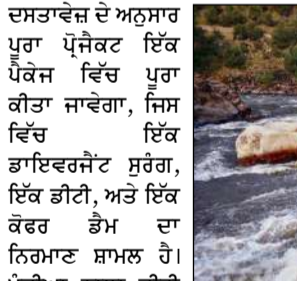
ਸਾਵਲਕੋਟ ਹਾਈਡਰੋ ਪ੍ਰੋਜੈਕਟ ਲਈ ਇੱਕ ਟੈਂਡਰ ਜਾਰੀ ਕੀਤਾ ਹੈ। ਟੈਂਡਰ ਦਸਤਾਵੇਜ਼ ਦੇ ਅਨੁਸਾਰ ਪੂਰਾ ਪ੍ਰੋਜੈਕਟ ਇੱਕ ਪੈਕੇਜ ਪੂਰਾ ਕੀਤਾ ਜਾਵੇਗਾ, ਜਿਸ ਵਿੱਚ ਡਾਇਰੈਕਟਰੀ ਸੁਰੰਗ, ਇੱਕ ਡੀਟੀ, ਅਤੇ ਇੱਕ ਕੋਂਕਰ ਡੈਮ ਦਾ ਨਿਰਮਾਣ ਸ਼ਾਮਲ ਹੈ। ਮੰਡੀਆ ਨਾਲ ਡੀਟੀ ਤੋਂ ਇਲਾਵਾ ਇਸ ਪੈਕੇਜ ਦੇ ਤਹਿਤ ਸਾਰੇ ਸੰਬੰਧਿਤ ਸੜਕ ਨਿਰਮਾਣ, ਸੱਜੇ ਕੰਢੇ ਸਪਾਈਰਲ ਸੁਰੰਗ ਅਤੇ ਪਹੁੰਚ

ਜ਼ਿਕਰ ਪੰਜਾਬ ਰੈਦਰਾਬਾਦ : ਪਾਕਿਸਤਾਨ ਨਾਲ ਸਿੰਧੂ ਜਲ ਸੰਧੀ ਨੂੰ ਮੁਅੱਤਲ ਕਰਨ ਤੋਂ ਬਾਅਦ, ਮੋਦੀ ਸਰਕਾਰ ਨੇ ਚਨਾਬ ਨਦੀ 'ਤੇ ਵੱਡੇ ਬੁਨਿਆਦੀ ਢਾਂਚੇ ਅਤੇ ਉਰਜਾ ਪ੍ਰੋਜੈਕਟਾਂ ਵੱਲ ਇੱਕ ਮਹੱਤਵਪੂਰਨ ਕਦਮ ਚੁੱਕਿਆ ਹੈ। ਸਰਕਾਰੀ ਮਾਲਕੀ ਵਾਲੀ ਐੱਨ ਐੱਚ ਪੀ ਸੀ ਨੇ ਜੰਮੂ ਅਤੇ ਕਸ਼ਮੀਰ ਦੇ ਰਾਮਬਨ ਜਿਲ੍ਹੇ ਵਿੱਚ ਸਾਵਲਕੋਟ ਪਣ-ਬਿਜਲੀ ਪ੍ਰੋਜੈਕਟ ਦੇ ਨਿਰਮਾਣ ਲਈ ਇੱਕ ਟੈਂਡਰ ਜਾਰੀ ਕੀਤਾ ਹੈ। ਐੱਨ ਐੱਚ ਪੀ ਸੀ ਨੇ 5,129 ਕਰੋੜ ਦੀ ਲਾਗਤ ਨਾਲ ਚਨਾਬ ਨਦੀ 'ਤੇ