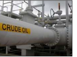
ਕਿਹਾ ਗਿਆ ਸੀ ਕਿ ਵਾਸ਼ਿੰਗਟਨ ਭਾਰਤੀ ਵਸਤਾਂ 'ਤੇ ਟੈਕਸ 50 ਫੀਸਦੀ ਤੋਂ ਘਟਾ ਕੇ 18 ਫੀਸਦੀ ਕਰ ਦੇਵੇਗਾ, ਬਦਲੇ ਵਿੱਚ ਭਾਰਤ ਰੂਸੀ ਤੇਲ ਦੀ ਖਰੀਦ ਬੰਦ ਕਰੇਗਾ ਅਤੇ ਵਪਾਰਕ ਤੁਕਾਵਟਾਂ ਨੂੰ ਖ਼ਾਕੀ ਸਫ਼ਾ 2 'ਤੇ

ਜ਼ਿਕਰ ਪੰਜਾਬ ਨਵੀਂ ਦਿੱਲੀ : ਭਾਰਤ ਨੇ ਸ਼ਨਿੱਚਰਵਾਰ ਨੂੰ ਨਾ ਤਾਂ ਇਸ ਗੱਲ ਦੀ ਪੁਸ਼ਟੀ ਕੀਤੀ ਅਤੇ ਨਾ ਹੀ ਇਨਕਾਰ ਕੀਤਾ ਕਿ ਉਸ ਨੇ ਰੂਸੀ ਕੱਚੇ ਤੇਲ ਦੀ ਖਰੀਦ ਬੰਦ ਕਰਨ ਦਾ ਫੈਸਲਾ ਕੀਤਾ ਹੈ। ਗ਼ੈਰਤਲਬ ਹੈ ਕਿ ਅਮਰੀਕਾ ਨੇ ਭਾਰਤੀ ਵਸਤਾਂ 'ਤੇ ਲਗਾਏ ਗਏ 25 ਫੀਸਦੀ ਦੰਡਕਾਰੀ ਟੈਕਸ ਨੂੰ ਵਾਪਸ ਲੈ ਲਿਆ ਹੈ, ਜੋ ਕਿ ਨਵੀਂ ਦਿੱਲੀ ਦੁਆਰਾ ਰੂਸ ਤੋਂ ਪੈਟਰੋਲੀਅਮ ਉਤਪਾਦਾਂ ਦੀ ਖਰੀਦ ਕਾਰਨ ਲਗਾਇਆ ਗਿਆ ਸੀ। ਅਮਰੀਕੀ ਰਾਸ਼ਟਰਪਤੀ ਡੋਨਲਡ ਟਰੰਪ ਨੇ 25 ਫੀਸਦੀ ਵਾਧੂ ਟੈਕਸ ਨੂੰ ਹਟਾਉਣ ਦੇ ਇੱਕ ਕਾਰਜਕਾਰੀ