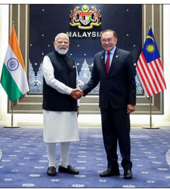
ਕਿਹਾ ਕਿ ਭਾਰਤ ਮਲੇਸ਼ੀਆ ਨਾਲ ਆਪਣੇ ਸਬੰਧਾਂ ਨੂੰ ਇੱਕ ਨਵੀਂ ਉਚਾਈ 'ਤੇ ਲਿਆਣਾ ਚਾਹੁੰਦਾ ਹੈ। ਭਾਰਤ ਨੇ ਮਲੇਸ਼ੀਆ ਵਿੱਚ ਇੱਕ ਨਵਾਂ 'ਕੋਸਲੇਟ ਜਨਰਲ' ਖੋਲ੍ਹਣ ਅਤੇ ਕੁਆਲਾਲੰਪੁਰ ਦੀ ਯੂਨੀਵਰਸਿਟੀ 'ਚ ਖ਼ਾਕੀ ਸਫ਼ਾ 2 'ਤੇ

ਜ਼ਿਕਰ ਪੰਜਾਬ ਨਵੀਂ ਦਿੱਲੀ/ਬਿਊਰੋ ਭਾਰਤ ਅਤੇ ਮਲੇਸ਼ੀਆ ਨੇ ਸੈਮੀ-ਕੰਡਕਟਰ ਬਣਾਉਣ ਅਤੇ ਡਿਜੀਟਲ ਭੁਗਤਾਨ ਪ੍ਰਣਾਲੀ ਨੂੰ ਸੁਖਾਲਾ ਬਣਾਉਣ ਲਈ ਅਹਿਮ ਸਮਝੌਤਿਆਂ 'ਤੇ ਦਸਤਖਤ ਕੀਤੇ ਹਨ।