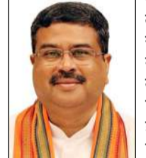
ਰਾਮਚੰਦਰ ਪ੍ਰਧਾਨ, ਕੇਂਦਰੀ ਸਿੱਖਿਆ ਮੰਤਰੀ

ਜਰ੍ਹਾਂ ਵਿੱਚ ਸਥਿਰ ਰਹਿੰਦੇ ਹੋਏ ਦੁਨੀਆਂ ਨਾਲ ਜੁੜਦੇ ਹਨ, ਉਹ ਵੀ ਵਰਤਮਾਨ ਵਿੱਚ ਵਿਕਸਿਤ ਭਾਰਤ ਦਾ ਨਿਰਮਾਣ ਕਰ ਰਹੇ ਹਨ। ਅਜਿਹੇ ਬੱਚਿਆਂ ਦਾ ਸਮਰਥਨ ਇੱਕ ਅਜਿਹੀ ਸਿੱਖਿਆ ਪ੍ਰਣਾਲੀ ਰਾਹੀਂ ਕੀਤਾ ਜਾਣਾ ਚਾਹੀਦਾ ਹੈ, ਜੋ ਦਿਮਾਗ, ਦਿਲ ਅਤੇ ਹੱਥਾਂ-ਪੈਰਾਂ ਦੇ ਵਿਕਾਸ 'ਤੇ ਕੇਂਦਰਿਤ ਹੋਵੇ; ਇੱਕ ਅਜਿਹੀ ਪ੍ਰਣਾਲੀ ਜੋ ਪ੍ਰਤੀਬੱਧ ਅਤੇ ਉਤਸੁਕ ਮਨਾਉਂਦੀ ਹੈ, ਉਦੇਸ਼ ਨੂੰ ਪੱਕਿਤ ਕਰੇ, ਅਤੇ ਉਨ੍ਹਾਂ ਨੂੰ ਸਾਰਥਕ ਜੀਵਨ ਲਈ ਤਿਆਰ ਕਰੇ। ਇਹੀ ਹੀ ਪਹਿਲਕਦਮੀ ਪੈ ਚਰਚਾ ਦੀ ਭਾਵਨਾ: ਬੱਚਿਆਂ ਨੂੰ ਭਰ ਤੋਂ ਮੁਕਤ ਕਰਨਾ ਅਤੇ ਉਨ੍ਹਾਂ ਨੂੰ ਭਾਰਤ 02047 ਦੇ ਲਈ ਆਤਮ-ਵਿਸ਼ਵਾਸ ਨਾਲ ਭਰਪੂਰ ਨਾਗਰਿਕ ਦੇ ਰੂਪ ਵਿੱਚ ਤਿਆਰ ਕਰਨਾ।